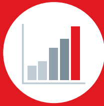
Big Data Analytics