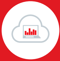
Cloudburst für Lastspitzen