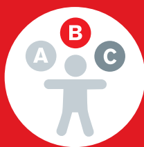
Test & Entwicklung